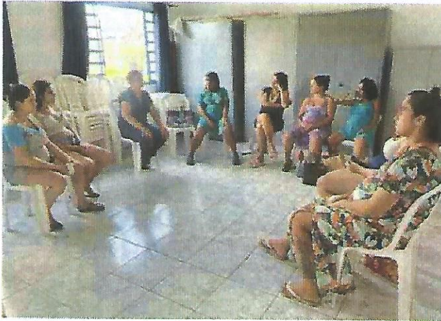
Palestra socioeducativa. Data: 13/02/2025.

RUA ALVARES CABRAL, 381 - CAMPO DO GALVÃO - GUARATINGUETÁ - SP CEP 12505-070 - FONE 3132 7959 CNPJ 48.548.184/0001-55 www.irmaoaltino.com.br - E-mail gf@irmaoaltino.com.br