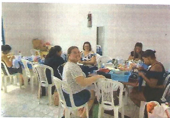
Oficina de fuxico e pintura. Data: 04/02/2025.

Observações: Durante o mês de fevereiro, as gestantes que ingressaram recentemente no projeto já conseguiram encontrar e se adaptar às oficinas que mais atendem às suas preferências.