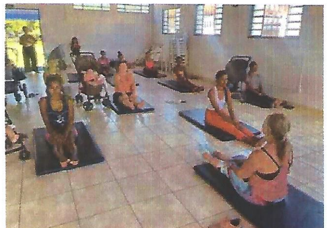
Aula de relaxamento e dança. Data: 18/02/2025.