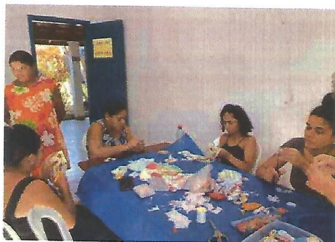
Oficina de fuxico. Data: 06/02/2025.