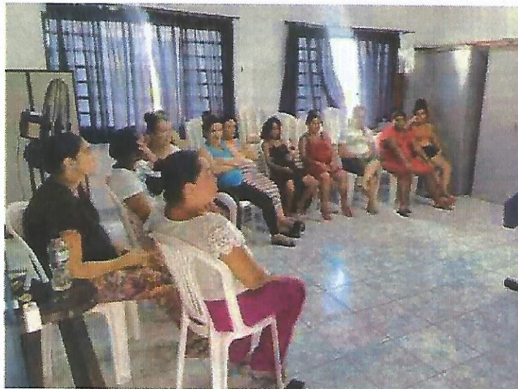
Palestra socioeducativa. Data: 20/02/2025.