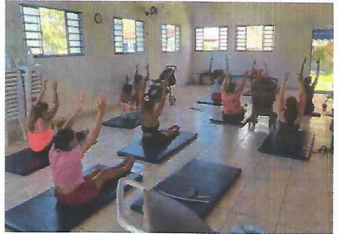
Aula de relaxamento e dança. Data: 18/02/2025.