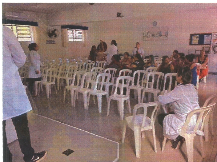
Palestra socioeducativa. Data: 30/04/2026.