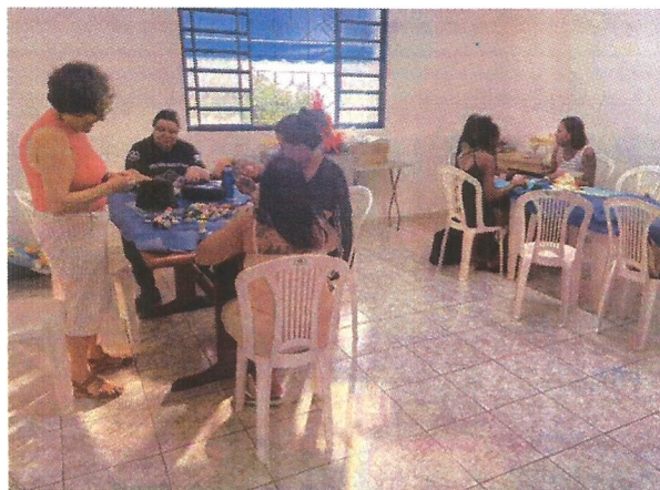
Oficina de fuxico e vagonite. Data: 30/04/2026.