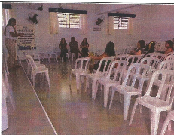
Palestra socioeducativa. Data: 14/04/2026.