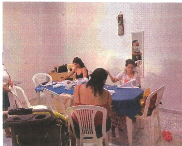
Oficina de vagonite. Data: 07/04/2026.