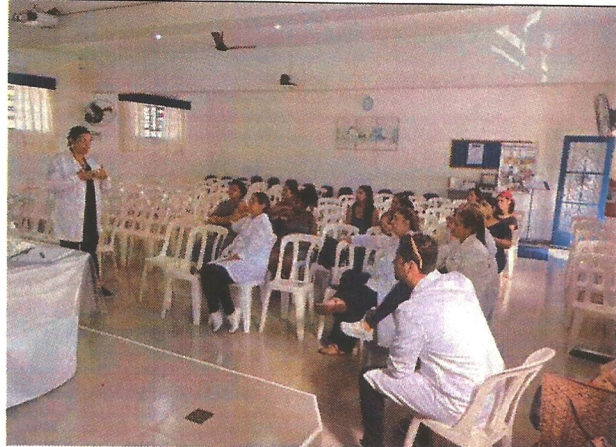
Palestra socioeducativa. Data: 09/04/2026.