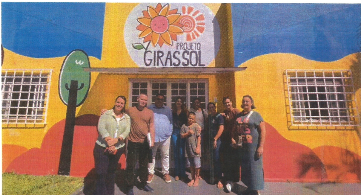
Visita Institucional. Data: 16/04/2026.

[Handwritten signature] [Handwritten initials]