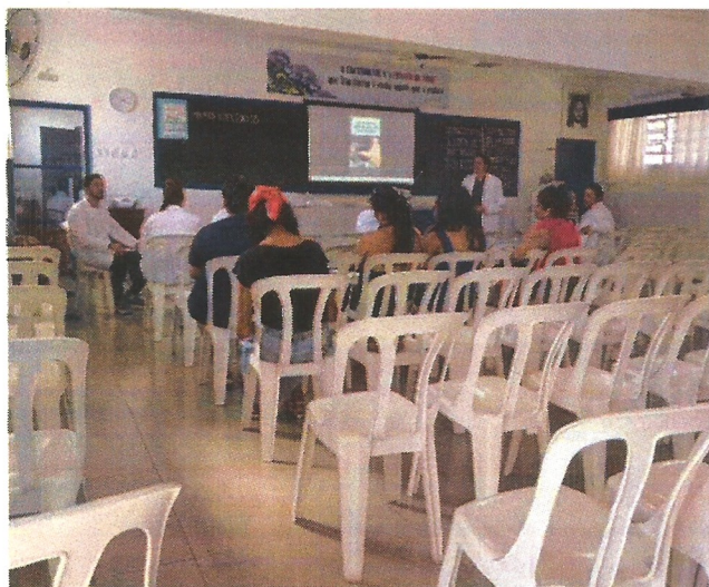
Palestra socioeducativa. Data: 09/04/2026.