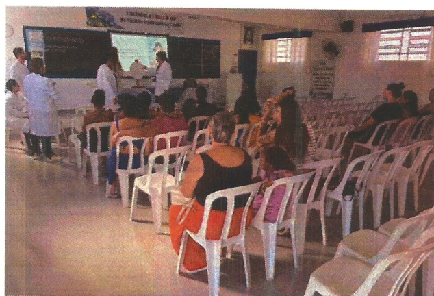
Palestra socioeducativa. Data: 30/04/2026.