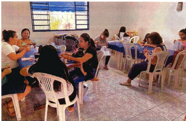
Oficina de fuxico e vagonite. Data: 27/01/2026.

RUA ALVARES CABRAL, 381 - CAMPO DO GALVÃO - GUARATINGUETÁ - SP CEP 12505-070 - FONE 3132 7959 CNPJ 48.548.184/0001-55 www.irmaoaltino.com.br - E-mail gf@irmaoaltino.com.br