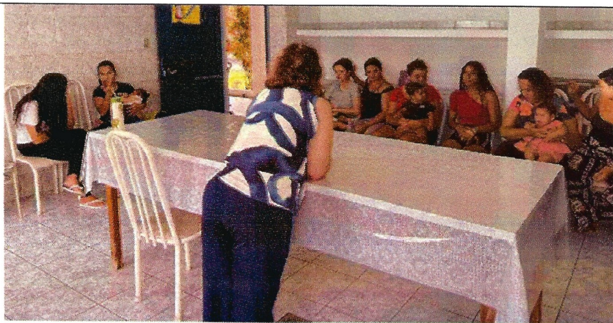
Atividade socioeducativa. Data: 27/01/2026.

Observações: Nos demais dias, não houve a presença das usuárias para a realização do serviço.