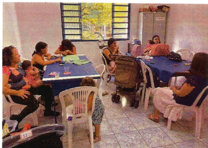
Oficina de bordado. Data: 27/01/2026.