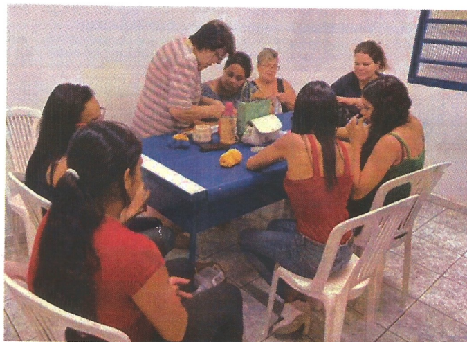
Oficina de tricô. Data: 19/03/2026.