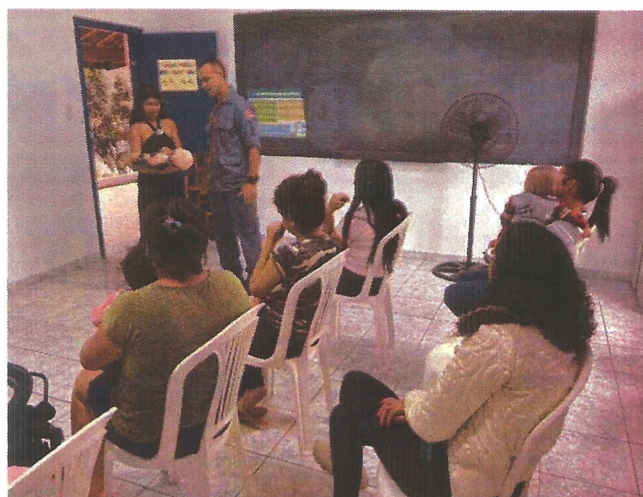
Palestra socioeducativa. Data: 10/03/2026.