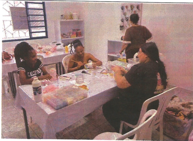
Oficina de pintura. Data: 19/03/2026.