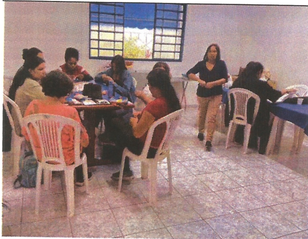
Oficina de fuxico. Data: 12/03/2026.