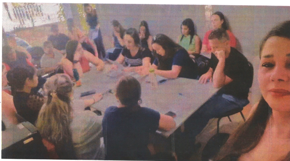
Reunião ordinária. Data: 17/03/2026.