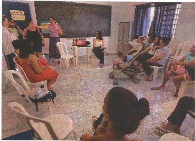
Palestra socioeducativa. Data: 17/03/2026.