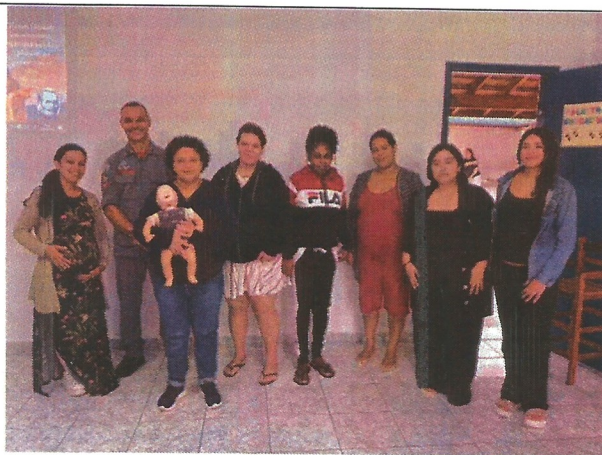
Palestra socioeducativa. Data: 12/03/2026.