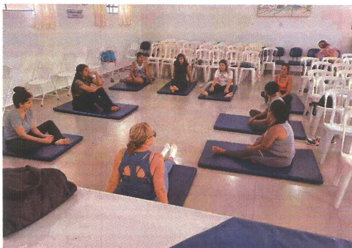
Atividade socioeducativa. Data: 03/03/2026.