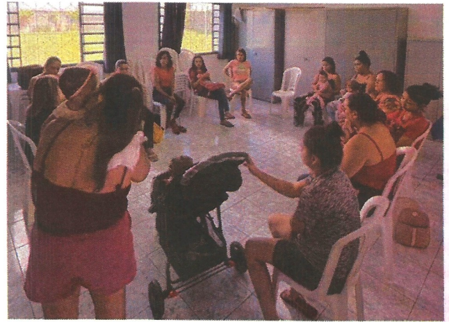
Palestra socioeducativa. Data: 24/03/2026.