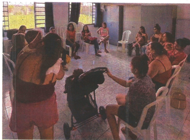
Palestra socioeducativa. Data: 24/03/2026.