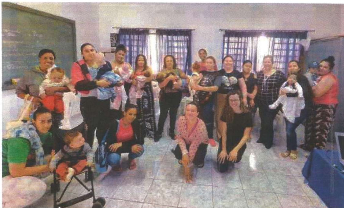
Palestra Socioeducativa com nutricionistas.