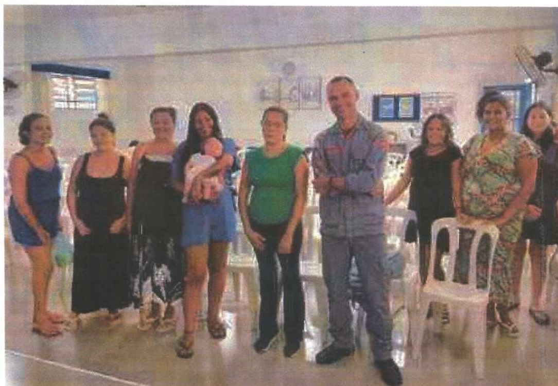
Palestra Socioeducativa com Corpo de Bombeiros.