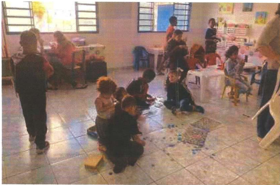
Sala de recreação.

RUA ÁLVARES CABRAL, 381 - CAMPO DO GALVÃO - GUARATINGUETÁ- SP CEP 12505-070 - FONE: (12) 3132-7959 - CNPJ 48 548 184/0001-55 www.irmaoaltino.com.br - E-mail: gf@irmaoaltino.com.br