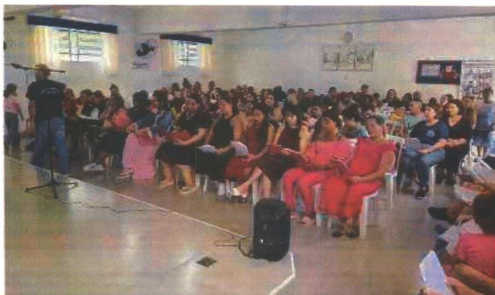
Comemoração Natal do Plano BEM.