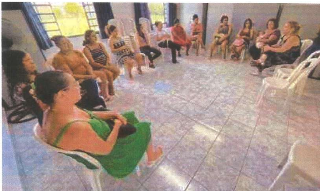
Palestra Socioeducativa com Conselho Municipal dos Direitos das Mulheres.